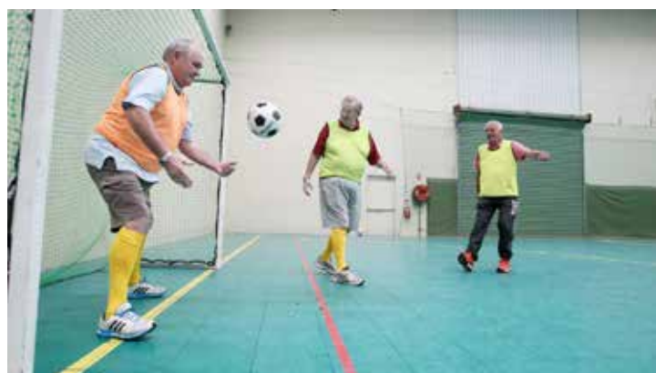
▲ Maakt u ook deel uit van het N-VA-team dat in september deelneemt aan een wandelvoetbaltoernooi?