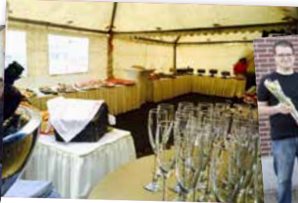
▲ In april organiseerden wij een lekker ontbijt voor onze leden. Bent u er de volgende keer ook bij?