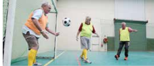
Wandelvoetbalt u mee met ons? p.3