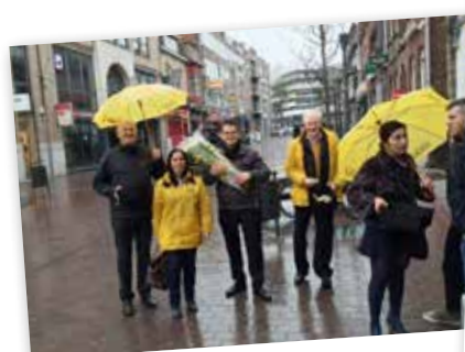
▲ De Valentijnactie in Genk-centrum werd gesmaakt.

Onze afdeling zat de laatste maanden niet stil. Wij behouden graag het contact met u en verwennen u op tijd en stond met een leuk presentje.