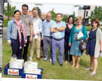
▲ De vaders kregen een Duveltje en een authentieke N-VA-flessenopener.