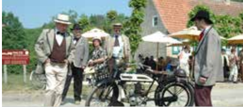
Bokrijk moet troeven uitspelen p.2