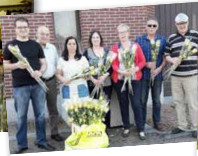
▲ Ook Moederdag en Vaderdag gingen niet onopgemerkt voorbij. Voor de vrouwen was er een mooie roos.