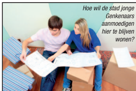
Hoe wil de stad jonge Genkenars aanmoedigen hier te blijven wonen?

Volgens de socialistische schepen van Participatie krijgt iedere burger inspraak in het beleid, ook al werd de stem van de kiezer vorig jaar wel vakkundig onder de mat geveegd, maar dat terzijde. U en ik moeten dus geloven dat wij inspraak zullen krijgen in het beleid.