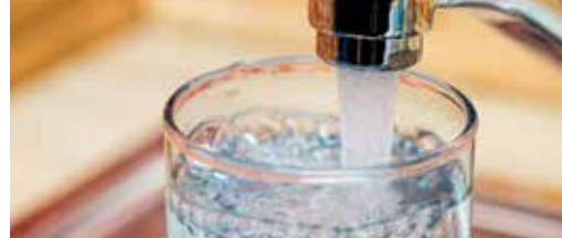
Vervuurd water in het ziekenhuis p.3