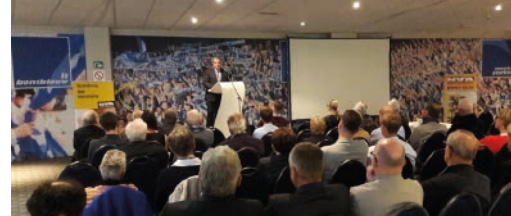
Minister Vandeput op bezoek in Genk p. 3