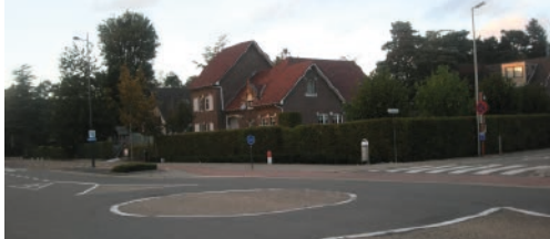
Is dit een rotonde of niet? p. 2